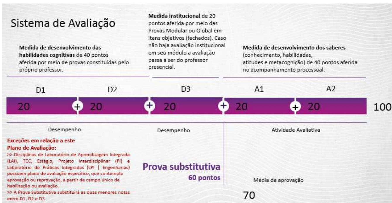
Figura 2 – Sistema de avaliação

O rendimento acadêmico dos alunos dos cursos de graduação deverá ser apurado atribuindo-se a eles 100 (cem) pontos cumulativos, através do sistema de avaliação ilustrado na imagem a seguir.